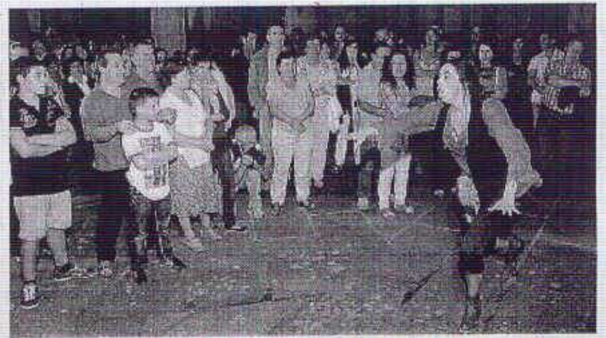
Una de las escenas de las visitas nocturnas teatralizadas a la Catedral